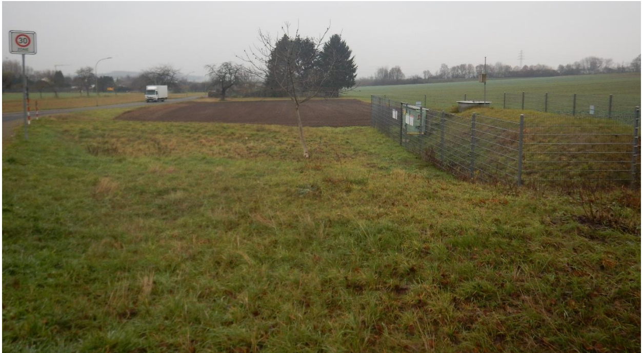
Abb. 2 Blick von Osten auf das Plangebiet

Besonders schützenswerte Pflanzenarten, die zumeist im Bereich seltener Biotoptypen mit besonderen Standortbedingungen zu finden sind, konnten im Rahmen der Geländebegehung nicht festgestellt werden. Auch gesetzlich geschützte Biotope oder außergewöhnlich wertvolle Biotoptypen sind im Plangebiet nicht vorhanden. Gebiete von gemeinschaftlicher Bedeutung (FFH-Gebiete, Vogelschutzgebiete) oder sonstige Schutzgebiete wie NSG / LSG werden von der Planung nicht berührt.